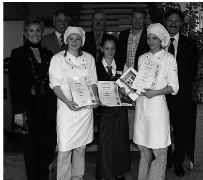
Das Siegerteam des Landesbewerbes EKS Fachbereich Tourismus.

Die Teams arbeiteten in Küche und Service, wobei für die Zubereitung eines dreigängigen Menüs zwei junge Köche/ Köchinnen verantwortlich waren. Der/die dritte Schüler/in hatte seine/ihre Fachkompetenz und Kreativität im Servicebereich unter Beweis zu stellen. Geladene Gäste konnten sich bei einem kulinarischen „Stelldichein“ von der Fachkompetenz der PTS-Schüler/innen überzeugen.