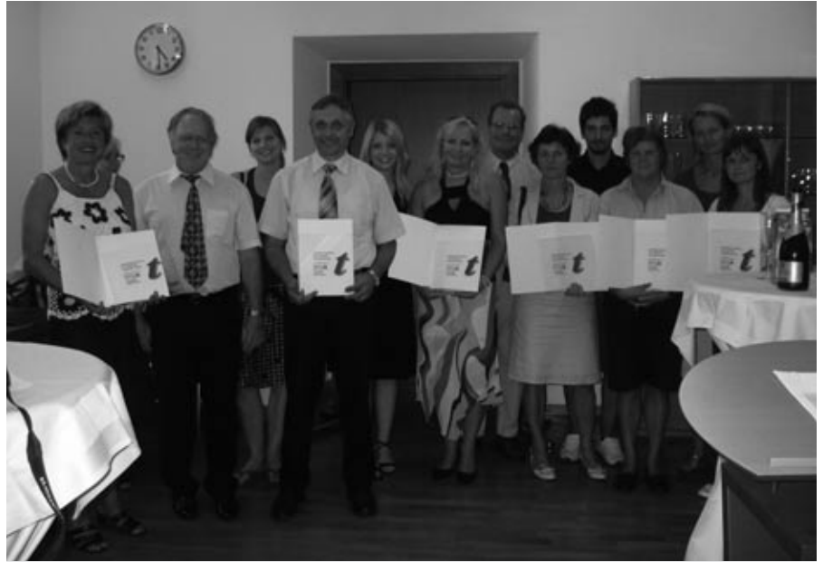
Die VertreterInnen der im Landesschulrat für Tirol mit dem Gütesiegel „Kompetenzzentrum für schulische Tagesbetreuung“ ausgezeichneten Schulen nach der Überreichung.

An der österreichweiten Aktion des BMUKK nahmen 18 Tiroler Schulen teil. Davon wurden 13 Schulen vom BMUKK ausgewählt und zertifiziert. Eine Landesjury kürte nach einem von einer ExpertInnenrunde entwickelten Punkteschlüssel die 7 „best practice“-Schulen. Diese wurden am 4. Juni 2008 von Bundesministerin Dr. Claudia Schmied in Wien ausgezeichnet. Die 6 weiteren zertifizierten Schulen wurden am 2. Juli 2008 im Landesschulrat für Tirol mit dem Gütesiegel „Kompetenzzentrum für schulische Tagesbetreuung“ ausgezeichnet. Alle zertifizierten Schulen zeichnen sich durch eine engagierte, qualitativ hochwertige Tagesbetreuung aus.